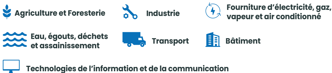
Figure 1 : Les macro-secteurs dans le champ d'application de la Taxonomie